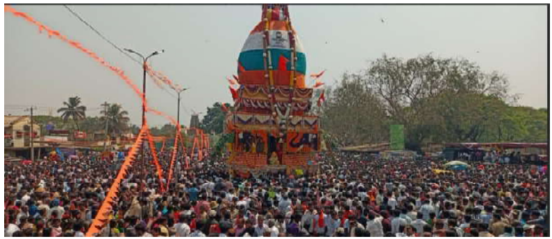
ಎಸೆದು ತಮ್ಮ ಹರಕೆ ತೀರಿಸುವ ಕೆಲಸ ಮಾಡಿದರು. ನವ ದಂಪತಿಗಳು ಆಗಮಿಸಿ ಬಾಳೆಹಣ್ಣು

ಗುಬ್ಬಿ: ಗುಬ್ಬಿ ಪಟ್ಟಣದ ಕ್ಷೇತ್ರಪಾಲಕ ಗುಬ್ಬಿಯಪ್ಪ ಎಂದೇ ಖ್ಯಾತಿ ಪಡೆದ ಗೋಸಲ ಶ್ರೀ ಚಿನ್ನಬಸವೇಶ್ವರಸ್ವಾಮಿ ಚಾತ್ರಾ ಮಹೋತ್ಸವ ಅಂಗವಾಗಿ ಭಾನುವಾರ ಜರುಗಿದ ರಥೋತ್ಸವಕ್ಕೆ ರಾಜ್ಯದ ನಾನಾ ಭಾಗಗಳಿಂದ ಆಗಮಿಸಿದ ಸಾವಿರಾರು ಭಕ್ತರು ಸಾಕ್ಷಿಯಾದರು. ಮುಂಜಾನೆಯಿಂದಲೇ ವಿವಿಧ ಧಾರ್ಮಿಕ ಕೈಂಕರ್ಯ ನಡೆದು ಮಧ್ಯಾಹ್ನ 1.45 ಕ್ಕೆ ಸಂಯೋಗ ರಥೋತ್ಸವಕ್ಕೆ ಸ್ವಾಮಿಯನ್ನು ಪಲ್ಲಕ್ಕಿ ವರವಣಿಗೆ ಮೂಲಕ ಕರತಂದೂ ರಥೋತ್ಸವದಲ್ಲಿ ಪ್ರತಿಷ್ಠಾಪಿಸಿ ಬೃಹತ್ ಕಲ್ಲಿನ ತೇರು ಸಾವಿರಾರು ಭಕ್ತರು ಎಳೆದರು. ಹರಕೆ ಹೊತ್ತ ಭಕ್ತರು ದವಸ ಸಿಲುಕಿಸಿದ ಬಾಳೆಹಣ್ಣು