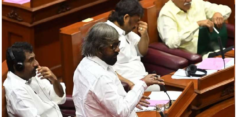
1,13,123 ಹೆಕ್ಟೇರ್ ಅರಣ್ಯ ಪ್ರದೇಶವಿದೆ. ಈ ಪ್ರಕೃತಿ 4001 ಪ್ರಕರಣಗಳಲ್ಲಿ 8,024 ಎಕರೆ ಅರಣ್ಯ ಭೂಮಿ ಒತ್ತುವರಿ ಅಥವಾ ಮಂಜೂರಾತಿ ಆಗಿದೆ. ಒತ್ತುವರಿ ತೆರವಿಗೆ 500 ಪ್ರಕರಣ ದಾಖಲಿಸಲಾಗಿದ್ದು, ತುಮಕೂರು, ಮಧುಗಿರಿ ಮತ್ತು ತಿಪಟೂರು ಉಪ ವಿಭಾಗದಲ್ಲಿ ಈವರೆಗೆ 457 ಎಕರೆ ಒತ್ತುವರಿ ತೆರವಿಗೆ ಆದೇಶ

ಬೆಂಗಳೂರು : ಶಿರಾ ತಾಲ್ಲೂಕು ಮುದಿಗೆರೆಯ ಅಮೃತ ಮಹಲ್ ಕಾವಲ್‌ನ 3025 ಎಕರೆ ಅರಣ್ಯ ಪ್ರದೇಶವನ್ನು ಅರಣ್ಯವಾಗಿ ಉಳಿಸಿ, ಅಭಿವೃದ್ಧಿ ಪಡಿಸಲಾಗುವುದು ಎಂದು ಅರಣ್ಯ ಸಚಿವ ಈಶ್ವರ್ ಖಂಡ್ರೆ ಭರವಸೆ ನೀಡಿದ್ದಾರೆ. ಸೋಮವಾರ ವಿಧಾನಸಭೆಯಲ್ಲಿನ ಪ್ರಶ್ನೆಗೆ ಅರಣ್ಯ ಸಚಿವರ ಉತ್ತರಿಸಿದ ಅವರು, ಮುದಿಗೆರೆ ಅಮೃತ ಮಹಲ್ ಅನ್ನು ರಾಜ್ಯ ಅರಣ್ಯ ಎಂದು ಅಂದಿನ ಮೈಸೂರು ಮಹಾರಾಜರು 1900ನೇ ಇಸವಿಯಲ್ಲಿ ಅಧಿಸೂಚನೆ ಹೊರಡಿಸಿರುತ್ತಾರೆ. ಒಂದು ಬಾರಿ ಅರಣ್ಯ ಎಂದು ಅಧಿಸೂಚನೆ ಆದ ಮೇಲೆ ಅದು ಅರಣ್ಯವಾಗಿ ಇರುತ್ತದೆ. ಅರಣ್ಯ ಭೂಮಿಯನ್ನು ಮಂಜೂರು, ದಾನ ಮಾಡಲು ಅವಕಾಶ ಇರುವುದಿಲ್ಲ ಎಂದು ಈಶ್ವರ್ ಖಂಡ್ರೆ ಸ್ಪಷ್ಟಪಡಿಸಿದರು. ತುಮಕೂರಿನಲ್ಲಿ 1,13,123 ಹೆಕ್ಟೇರ್ ಅರಣ್ಯ: ತುಮಕೂರು ಜಿಲ್ಲೆಯಲ್ಲಿ ಒಟ್ಟಾರೆ