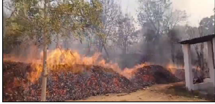
ಬೆಟ್ಟವು ಸುಮಾರು 100 ಎಕರೆ ವ್ಯಾಪ್ತಿಯ ವಿಸ್ತೀರ್ಣವಿದ್ದು, ಜಾಲಿಗಿರಿ ಮರಗಳ ಬೀಡಾಗಿದೆ, ಇದರ ಜೊತೆಗೆ ಮುತ್ತುಗ ಮತ್ತಿತರ ಕಾಡು ಮರಗಳಿಂದ

ಚಿಕ್ಕನಾಯಕನಹಳ್ಳಿ: ತಾಲ್ಲೂಕಿನ ಪುಣ್ಯಕ್ಷೇತ್ರಗಳಲ್ಲೊಂದಾದ ತಮ್ಮಡಿಹಳ್ಳಿ ಶ್ರೀ ಪರ್ವತ ಮಲ್ಲಕಾರ್ಜುನಸ್ವಾಮಿ ಬೆಟ್ಟಕ್ಕೆ ಬೆಂಕಿ ತಗುಲಿ ಅಪಾರ ಪ್ರಮಾಣದ ಅರಣ್ಯ ಹಾಗೂ ಪೈಪ್ಲೈನ್ ಗಳಿಗೆ ಹಾನಿಯಾದ ಘಟನೆ ನಡೆದಿದೆ.